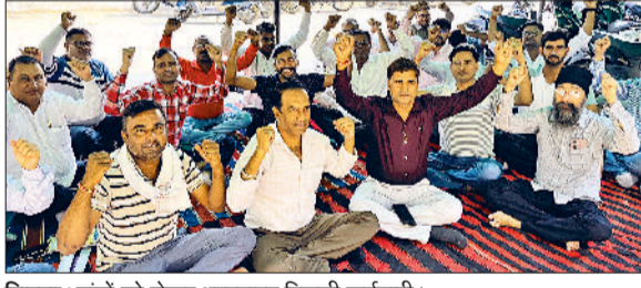
सिरसा। मांगों को लेकर धरनारत बिजली कर्मचारी।

दोनों जेई को सब डिवीजन से रिलीव करने का विरोध