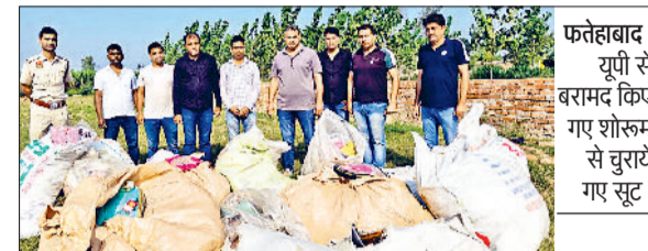
फतेहाबाद। यूपी से बरामद किए गए शोरूम से चुराये गए सूट।