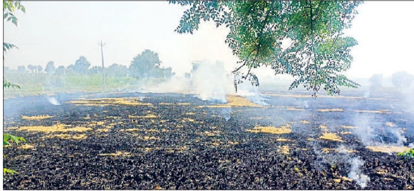
फतेहाबाद। पराली जलाने से उठता जहरीला धुआ। (फाइल फोटो)

धान की पराली जलाने के मामले में वीरवार तक हरसेक में कृषि विभाग को 7 लोकेशन भेजी हैं। कृषि विभाग की टीम जब मौके पर पहुंची तो 4 लोकेशन पराली में आगजनी पाई गई जबकि एक गैर कृषि क्षेत्र में भी जबकि एक लोकेशन ट्रेस नहीं हो पाई वहीं एक मामले में कानूनी प्रक्रिया जारी है। विभाग की शिकायत पर पुलिस ने 4 एफआईआर दर्ज की है। इन किसानों को विभाग ने 5-5 हजार रुपये चालान के नोटिस जारी किए हैं। जिन किसानों के खिलाफ एफआईआर दर्ज हुई है, उन किसानों के नाम रेड एंटी में दर्ज किए गए हैं। अब यह किसान दो साल तक एमएसपी पर सरकार को फसल नहीं बेच पाएंगे। दीपावली के बाद ऐसा पहली बार हो रहा है कि पराली जलाने की घटनाएं बढ़ रही हैं, जिसके चलते दीपावली के तीन दिन फतेहाबाद का वायु गुणवत्ता