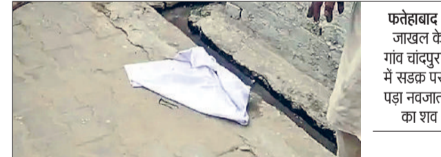
फतेहाबाद। जाखल के गांव चांदपुरा में सड़क पर पड़ा नवजात का शव।