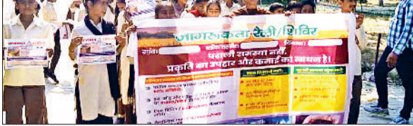
सिरसा। पराली की जागरूकता को लेकर रैली निकालते हुए स्कूली बच्चे।