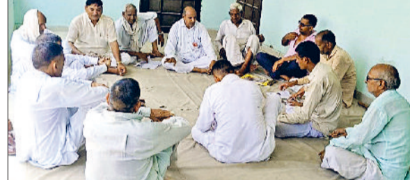
फतेहाबाद। किसान सभा की बैठक में मांगों को लेकर चर्चा करते किसान नेता।

सिान 27 को भट्ट तहसील कार्यालय पर करेंगे प्रदर्शन