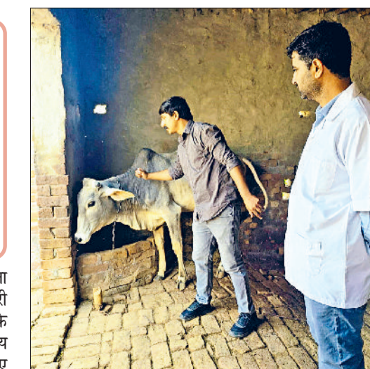
फतेहाबाद। अभियान के तहत पशुओं का टीकाकरण करते पशुपालन विभाग की टीम।